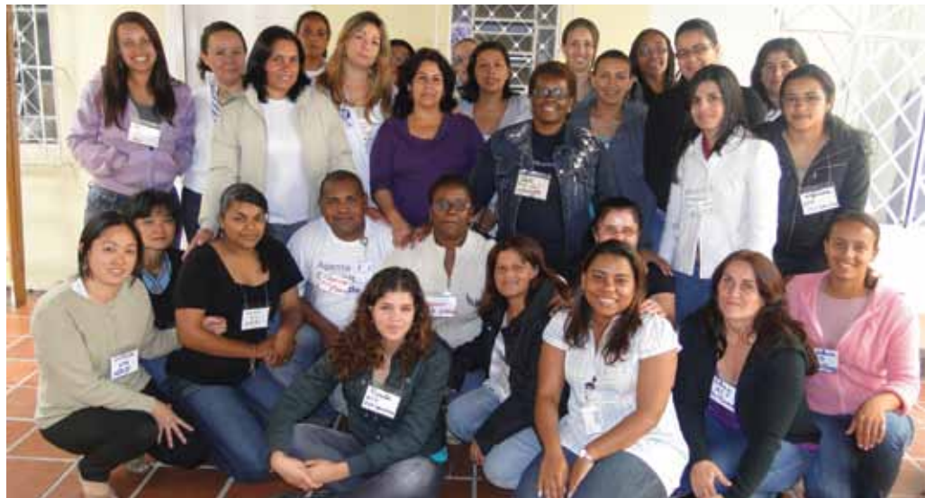
Equipe de Profissionais do Município de Mogi das Cruzes integrada e preparada para um novo trabalho